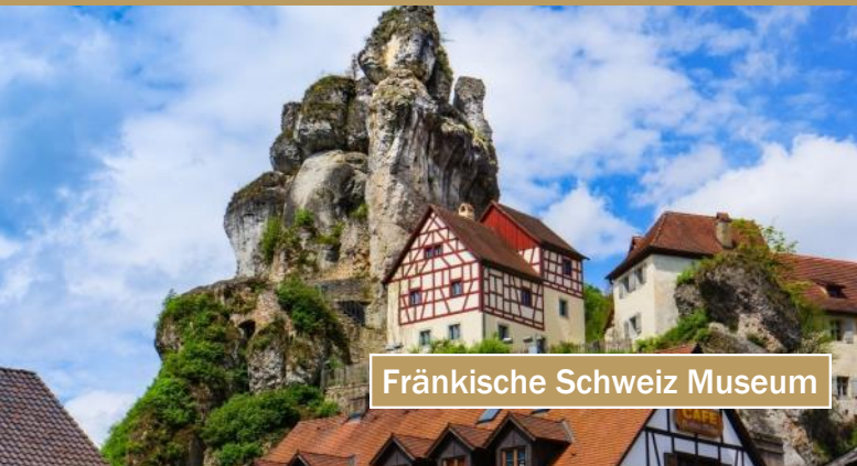
Fränkische Schweiz Museum